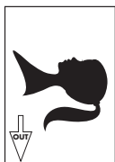
Image out Sortie image Ausgeberichtung Immagine Salida de imagen Transportrichtung

Spine on top Reliure en haut Bindung oben Sulla parte superiore della colonna Lomo arriba Bindrug boven