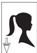
Image out Sortie image Ausgeberichtung Immagine Salida de imagen Transportrichtung

Spine on left Reliure à gauche Bindung links A sinistra della colonna Lomo a la izquierda Bindrug links