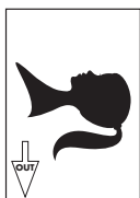
Image out Sortie image Ausgeberichtung Immagine Salida de imagen Transportrichtung

Spine on top Reliure en haut Bindung oben Sulla parte superiore della colonna Lomo arriba Bindrug boven