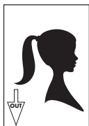
Image out Sortie image Ausgeberichtung Immagine Salida de imagen Transportrichtung

Spine on left Reliure à gauche Bindung links A sinistra della colonna Lomo a la izquierda Bindrug links